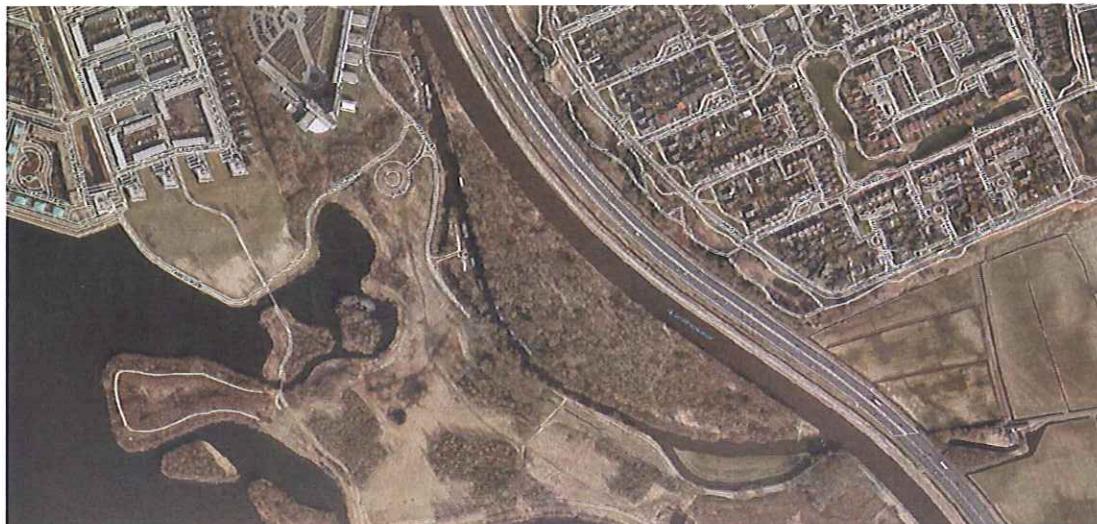
figuur 1: luchtfoto van het gebied