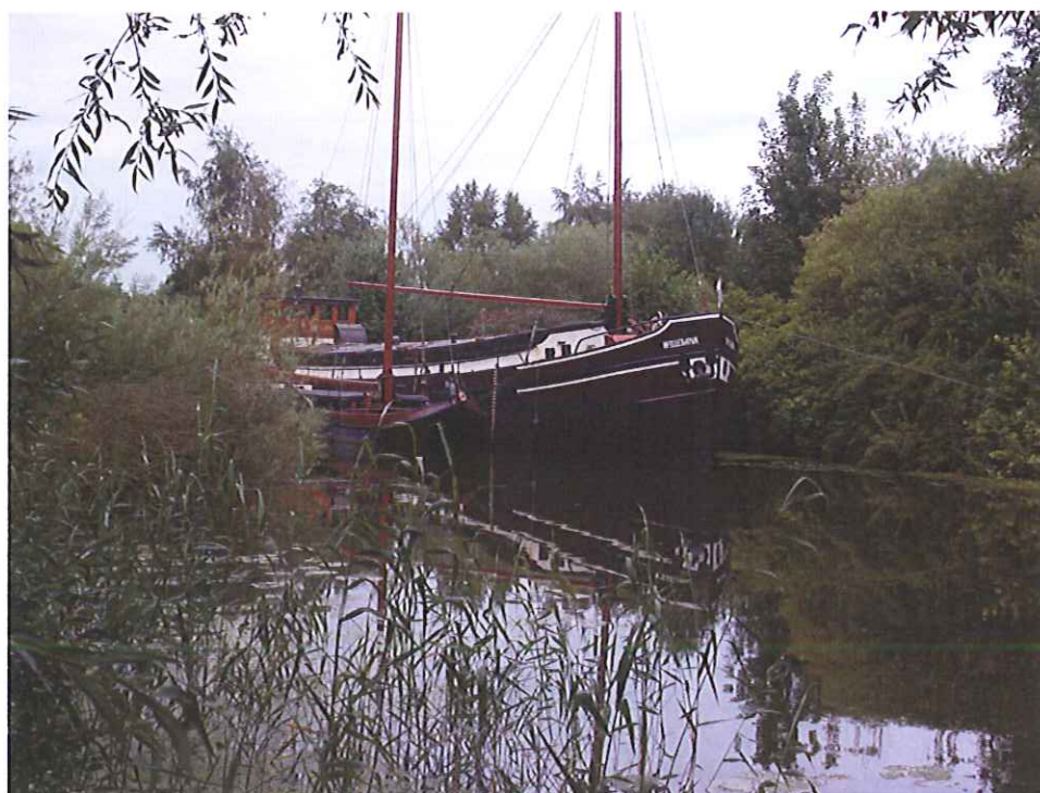
figuur 2: één van de woonboten in het Hoornse diep